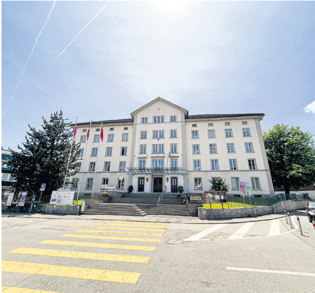
Das Kultur- und Kongresszentrum Zwei Raben als Stein des Anstosses und Zankapfel par excellence: Während die einen das Gebäude am liebsten abreißen würden, favorisieren andere die Alternative 3, in der aus dem Haus ein Begegnungsort und eine Eventlocation mit Generationenwohnen werden würde.