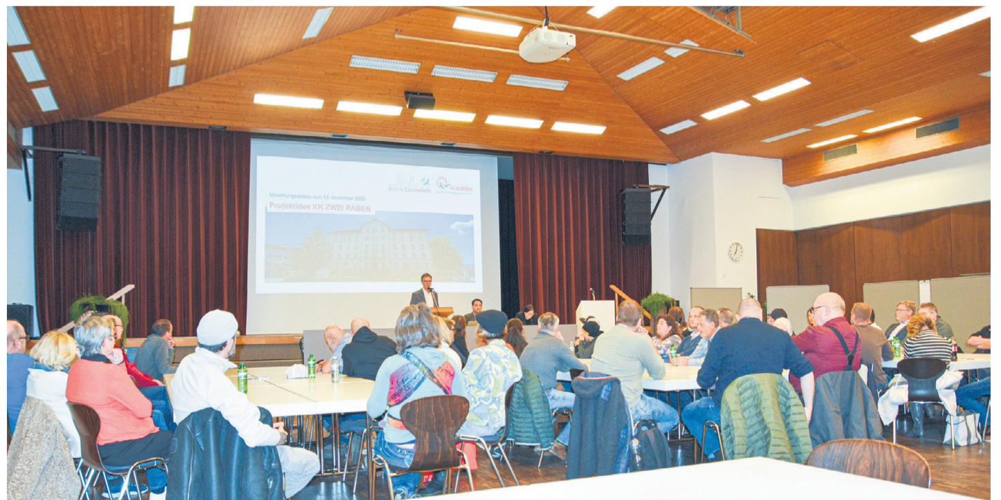
Der Bezirk Einsiedeln und die Genossenschaft Zwei Raben stellten am Mittwochabend an einer Informationsveranstaltung die Projektidee zur Weiterentwicklung des Kultur- und Kongresszentrums Zwei Raben vor.

Birchler warnte vor möglichen jahrelangen Querelen mit der Denkmalpflege: «Es ist zwar nicht ausgeschlossen, aber doch wenig realistisch, dass die Denkmalpflege einem Abbruch des Kultur- und Kongresszentrums grünes Licht erteilt.» Würde man sich auf eine Auseinandersetzung mit der Denkmalpflege einlassen, könnte ein jahrelanger Rechtsstreit drohen – mit dem Resultat, dass man am Ende mit leeren Händen dastehen würde – ohne Weiterentwicklung des Dorfzentrums in Einsiedeln.